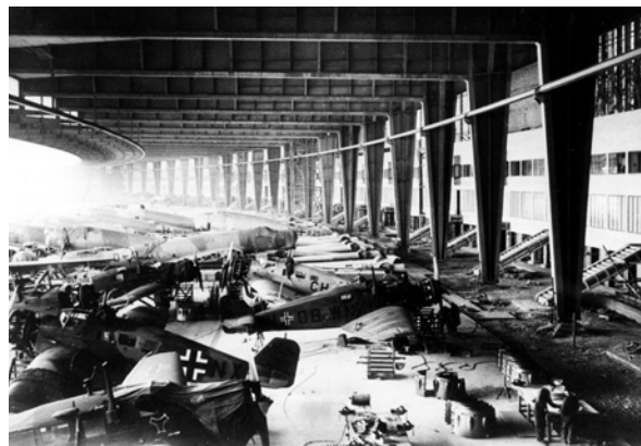
Rüstungsproduktion am neuen Flughafen, 1940/41

Die Texte der Ausstellung sind durchgehend zweisprachig (Deutsch/Englisch). Die kostenlose App „Projekt Flughafen Tempelhof“ stellt die Texte zusätzlich in Arabisch, Französisch, Russisch und Spanisch zur Verfügung. Sie ist im App Store und im Google Playstore erhältlich.