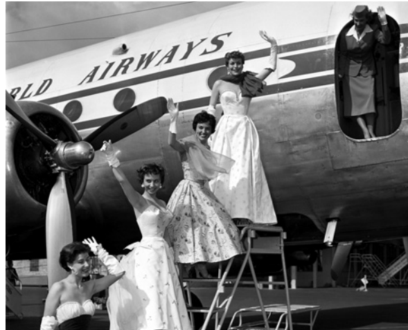
Modenschau auf dem Tempelhofer Flugfeld, 1954

Flughafen Tempelhof, um 1930